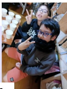
カードゲーム大会 (レシビ)